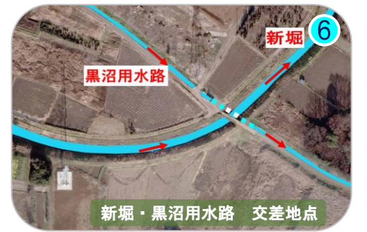
新塚・黒沼用水路 交差点