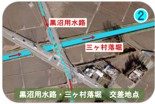
黒沼用水路・三ヶ村落 交差点