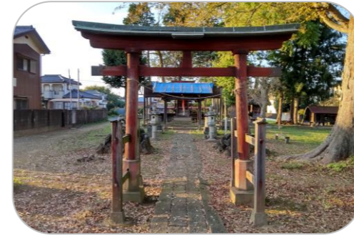
わしじんじゃ 岡泉鷲神社

陸上競技場、野球場、多目的広場、ナイター照明付きテニスコート、サブグラウンド、ジョギングコース、アスレチック広場などを備えた総合スポーツ施設です。隣接して白岡市 B&G 海洋センター（温水プール）もあります。