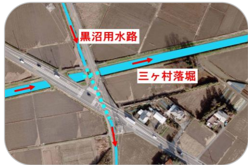
さんかそんおとしほり 黒沼用水路・三ヶ村落堀 交差点

天和元年（1681）この地に勧請と伝えられ、祭神は天穂日命（あめほひのみこと）です。 天保の頃（1830～44）に始まると伝えられる「大尽囃子（だいじんばやし）」と神楽（かぐら）が市指定文化財として伝承されています。 また、境内の大ケヤキが市天然記念物に指定されています。