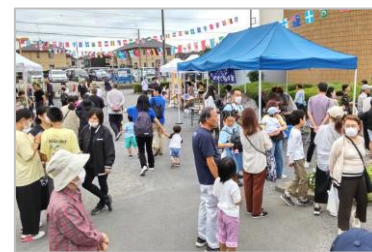
ふるさとまつり (コミュニティセンター)