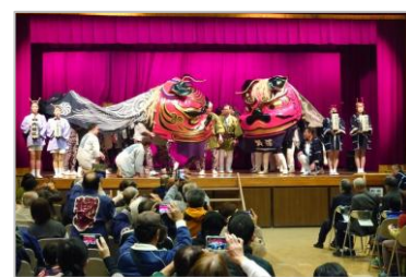
全日本獅子舞フェスティバル白岡 (獅子博物館・中央公民館)