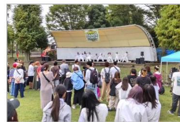
白岡 60!!ダンスフェスタ (ふれあいの森公園)