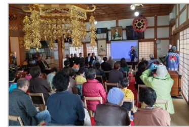
筑後様まつり (観福寺)