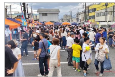
白岡駅西口やたい村