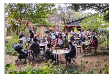
森のリトリート Day (太田新井地区)