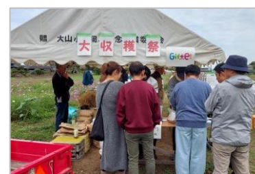
田んぼde収穫祭 (柴山地区)