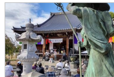
お寺フェスタ (安楽寺)