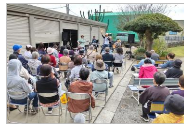
秋の東部地区オープンガーデン (彦兵衛地区)