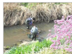
桜の名所 篠津地区 高台橋のごみ拾い