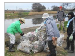
観桜会前のごみ拾い