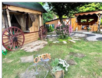
趣絵っ杜ガーデン

『来年は1番に来ますね』 こんな言葉が聞けて、1年後の構想が頭の中を駆け巡っています。