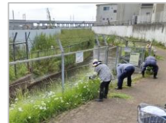
植花活動と草取り