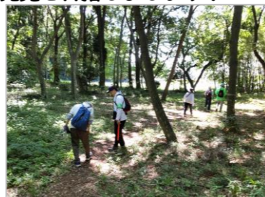
ひこべえの森にて