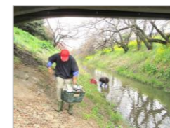
桜の名所 篠津地区 高台橋のゴミ拾い