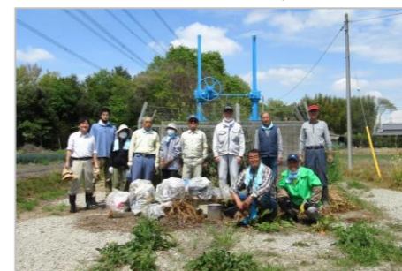
日勝地区ゴミ拾い