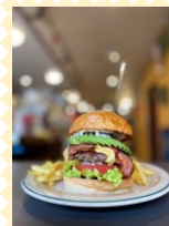
ハンバーガー ライスプレート SUN DOVE DINER