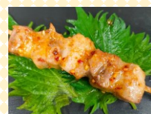
豚バラ串 (炭火焼) (株)エコバンク