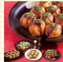
たこ焼き はすだこ