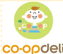
パンチ風船 プレゼント 生活協同組合 コープみらい