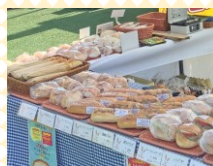
パン 白岡 ベーカリー