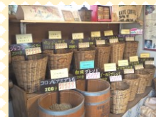
コーヒー 珈琲工房 ビーンズ・いまい