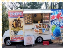
クレープ Crepe & coffee Hedgehog